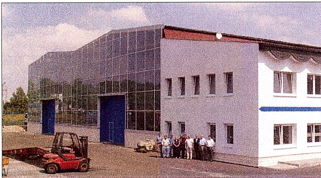
Das Lager am Stammsitz in Leipzig soll ausgebaut und die Hebekapazität auf 100 Tonnen erhöht werden

Die WMW AG ist ein internationales Handelshaus für neue und gebrauchte Industriemaschinen. Das Unternehmen hat sich nicht nur Geschäftskontakte in Westeuropa aufgebaut, sondern insbesondere auch im Nahen Osten. Mit Investitionen in neue Standorte und Hebeanlagen sowie der Einstellung weiterer Mitarbeiter bereitet sich WMW auf eine steigende Nachfrage auch in Osteuropa und Russland vor.